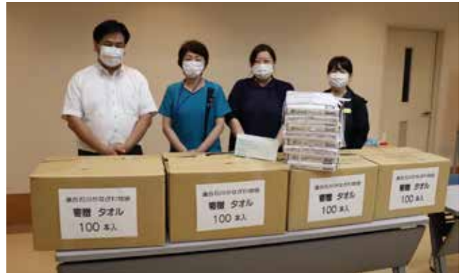
金沢子ども医療福祉センター

かなざわ地協では、各構成組合の協力のもと、昨年11月から「未使用タオルの収集」、またこの6月には新型コロナウイルス状況下における支援活動として「マスク寄付運動」に取り組んだ。