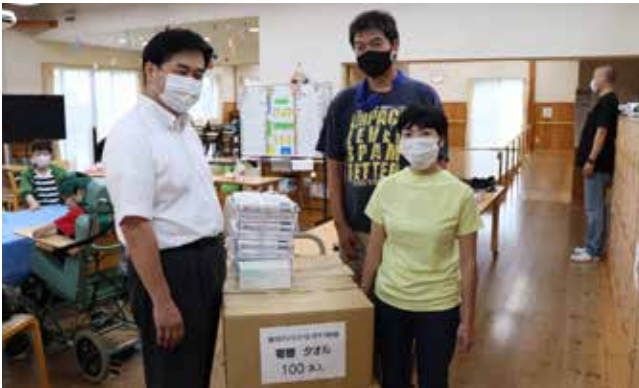
社会福祉法人ゆい