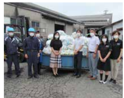
(株)日本海開発の皆さん