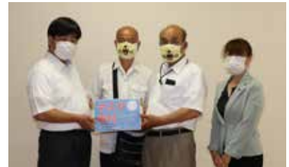
かほく市身体障害者福祉協会

7月6日(月)に金沢市「社会福祉法人ゆい」・「金沢子ども医療福祉センター」に訪問、また7月20日(月)には「かほく市身体障害者福祉協会」に赴き、タオルとマスクをそれぞれ寄贈した。各施設からは「大切に使用させていただきます。」との感謝の言葉をいただいた。